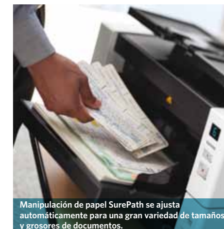
Manipulación de papel SurePath se ajusta automáticamente para una gran variedad de tamaños y grosores de documentos.

Los accesorios opcionales de formato legal y cama plana para A3 de Kodak para disponer de capacidad añadida y poder escanear documentos encuadernados, de gran tamaño y frágiles.